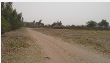
Arrivée à Keur Taïbe Sakho en brousse.

Jour 3 lundi 9 Visite à l'école primaire en brousse de Keur Taïbe Sakho. Très très chaud. voyage en voiture conduite par le chauffeur Idi. Après la traversée infernale de Mbour on découvre un paysage sur lequel on ne comptait plus. La savane parsemée de baobabs, eucalyptus, manguiers. Propre, paisible, du vent de fgs en kmph, parcourue par des troupeaux de vaches (Zébus ?) et leur bergers. Quelques caches crevées + vauvons Traversée de quelques villages où apparaissent les toits de paille des maisons de terre ou de parpaings construites en rond avec une batterie de branches pour former cornes. L'agne d'où le sel est extrait. Après Kaolack (ville n°2 après Mbour), c'est la piste pour aller à KTS. Nous sommes lundi. toute l'école est studieuse à classe planète pour nous accueillir.