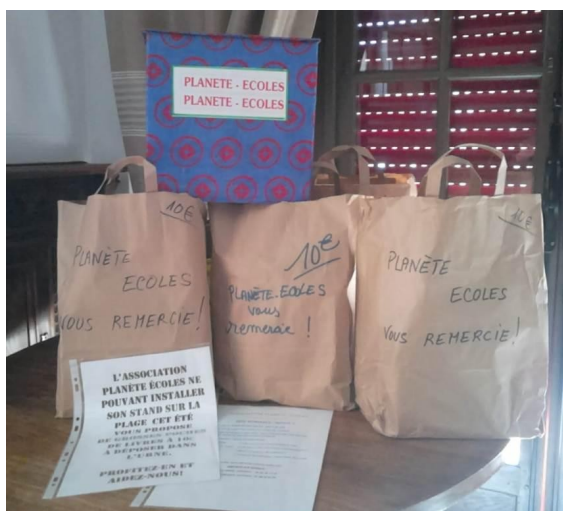
Les poches à Orhoitza