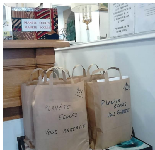
Les poches chez Bergeret-Sport