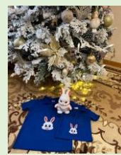
financés par P.E.

a été très imaginaire et actif pour garnir en cadeaux les sapins de Noël de la région. Et tirer quelques bénéfices de son travail.