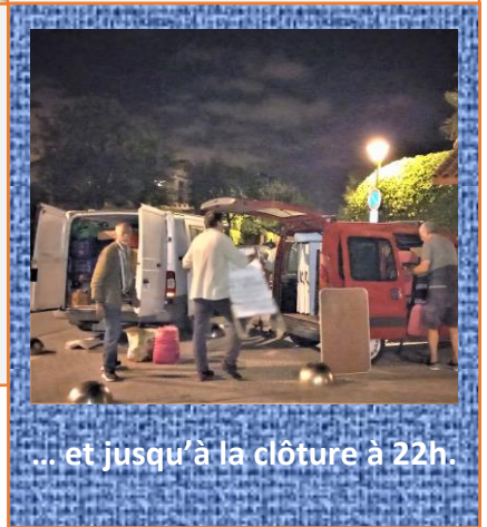
... et jusqu'à la clôture à 22h.