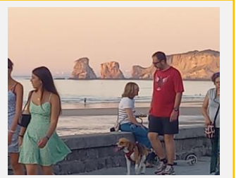
... la chance sourit !!! (Une seule annulation cet été)