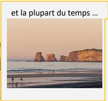
et la plupart du temps ...