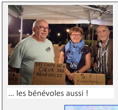
... les bénévoles aussi !