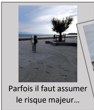
Parfois il faut assumer le risque majeur...

Les « équipes » sont prévues de longue date et le jour de la vente -si la météo a été jugée jouable- elles assureront les « passages de relais » de 8h45 à 22h30. Entre 15 et 20 bénévoles au total assurent le transport du matériel le matin et son installation sur le site, les ventes, le démontage du stand et le retour à Sopite .